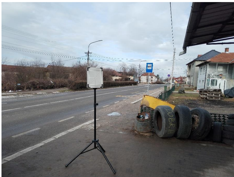
Prikaz mernog mest M1