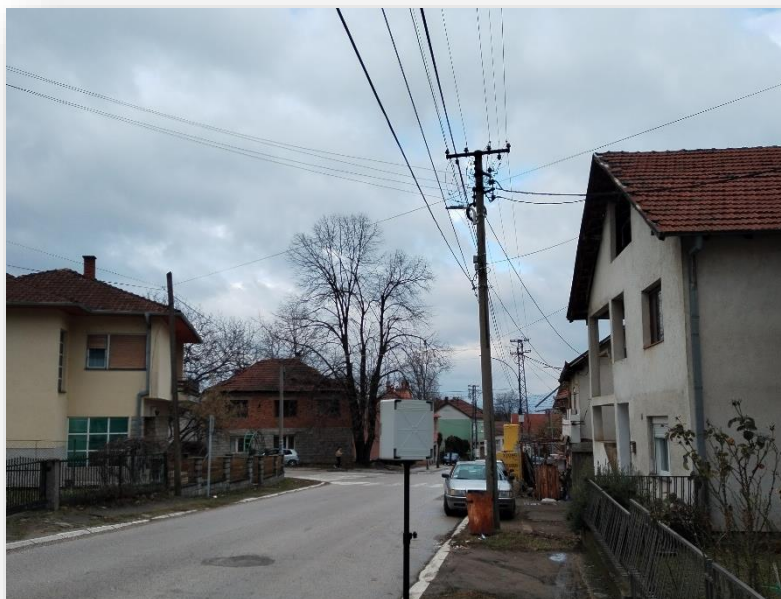
Prikaz mernog mest M2