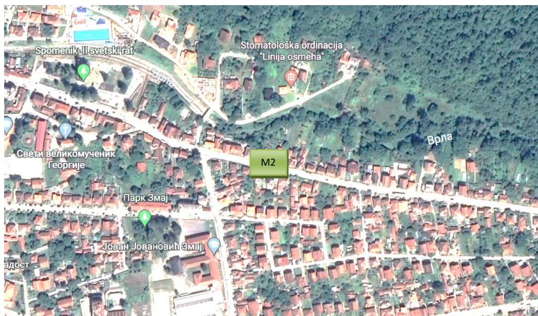
Prikaz mernog mest M2