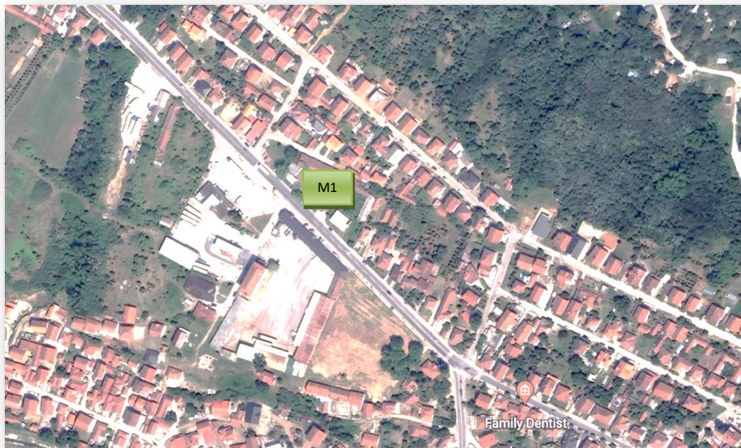
Prikaz mernog mest M1